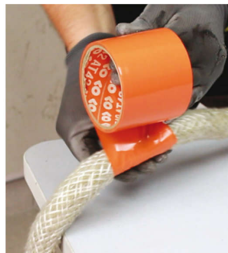
Oblepte FJ203, aby ste si uľahčili rezanie.