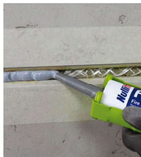
Špáru potom podľa potreby utesnite pomocou Nullifire FS702, FS703 alebo illbruck SP525.