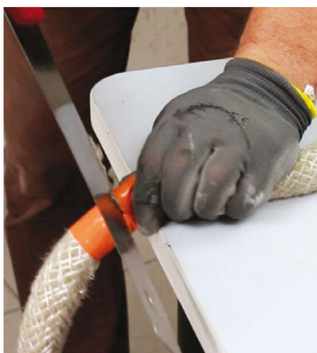
Odrežte povrazec Nullifire FJ203.